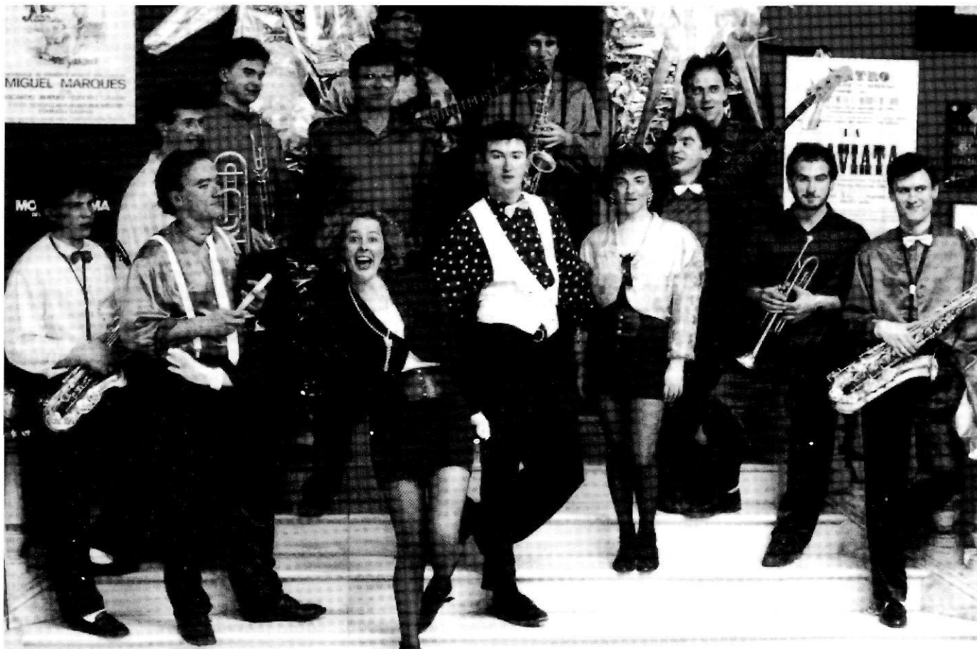
L'Orquestrina d'Algaida va animar la Festa de la Nit de Sant Joan.