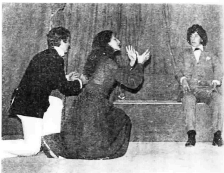
Dues escenes de «Tiempo de 98».