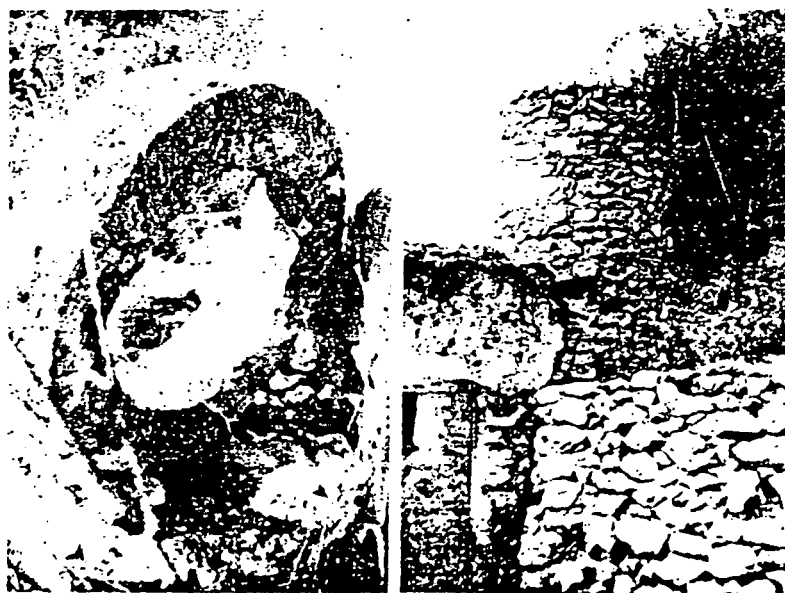
Païssa de Can Toni Xic (Cubells). Uno de los anillos del depósito de agua del Molino de G. de Montpalau