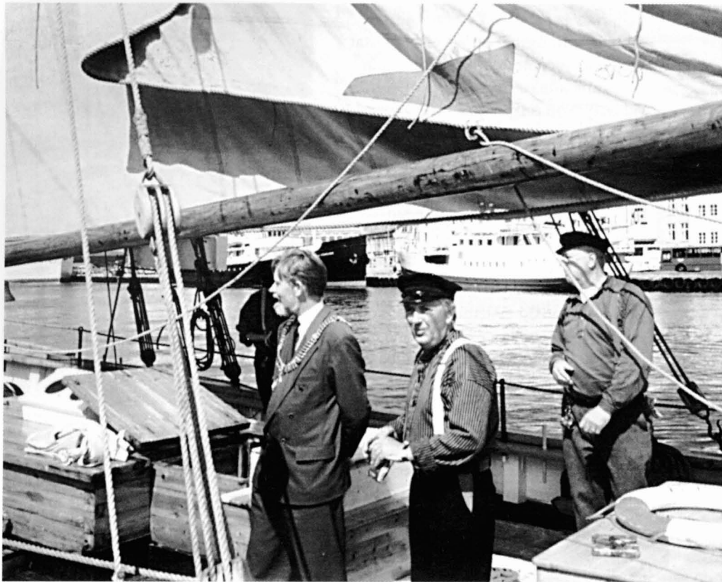
Sortida del vaixell Anna af Sand , cap a Donostia