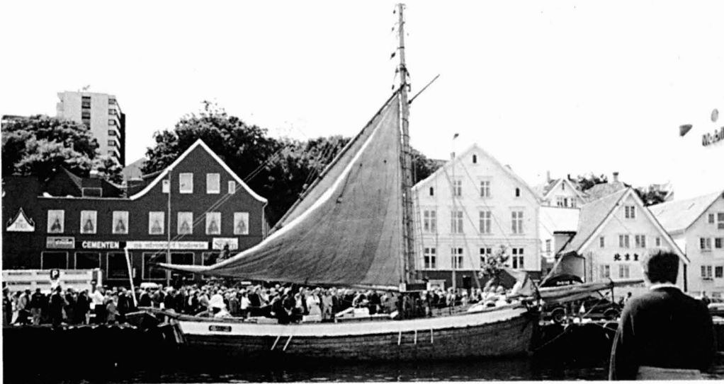
L'Anna af Sand al moll de Stavanger (Noruega).

trajectòria va canviar radicalment. Gairebé condemnat a desaparèixer, va ser localitzat per Marc Litchfield i els seus socis al port de Málaga, on es feia servir de pontó flotant. Se'n va projectar la restauració amb motiu del rodatge d'una pel·lícula que finalment, no es va realitzar. Malgrat això, la recuperació del veler es va acabar i l'any 1982 un Maria Assunta completament restaurat i que presentava el seu aspecte primigeni va tornar a fer-se a la mar.