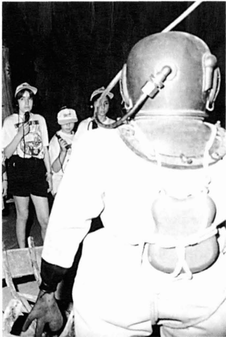
Detall de l'àmbit dedicat a la navegació submarina, a "LA Gran Aventura del Mar"