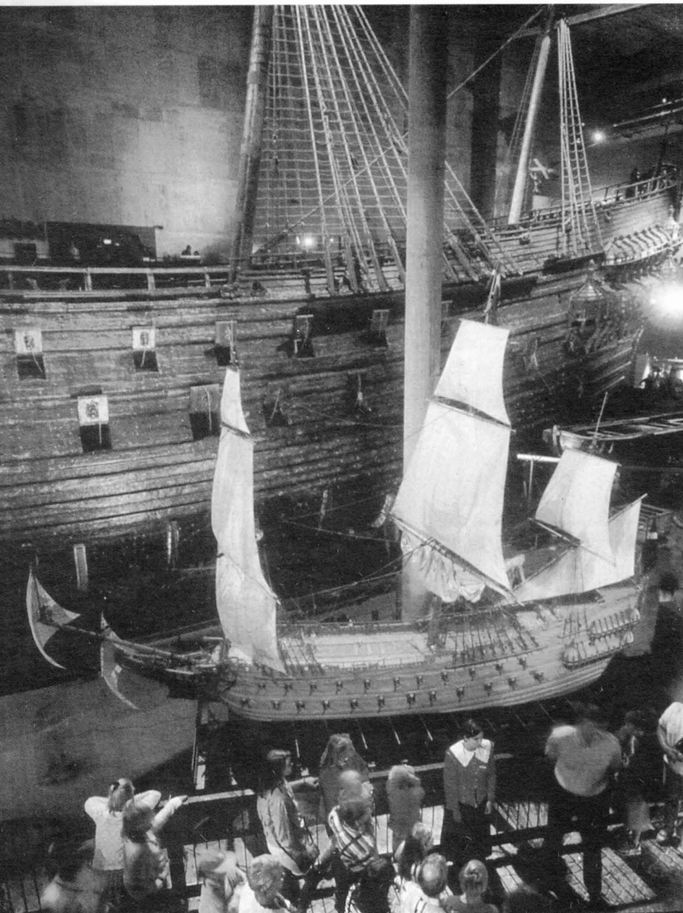
Un aspecte de l'exposició permanent del museu

nes excel·lents possibilitats per aprendre mitjançant la investigació d'objectes com a tals, però també com es van fer i com s'utilitzaven. Els alumnes poden tocar tots els seus sentits com també la seva imaginació. Així, si els museus serveixen d'eines per a l'escola, aleshores és molt important establir una estreta cooperació entre els educadors del museu i els mestres d'escola. Els educadors de museu han de ser conscients de com es treballa a l'escola i els mestres han de saber què poden oferir els museus. Les visites s'han de planificar amb cura. El treball de preparació a l'escola, els estudis al museu i el treball de seguiment han de quedar ben establerts prèviament.