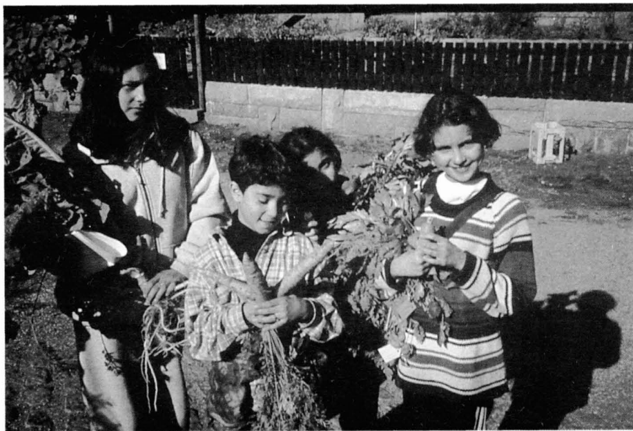
Activitats per a escolars

El treball amb fusta consistia a preparar-se per fer la pròpia cullera de fusta a l'escola, esbossant, mesurant i investigant diferents tipus de materials. Una visita d'aquest tipus pot suposar el punt de partida tant per preguntar-se què se servia a bord, o saber les tècniques que calen per sobreviure a l'època del Vasa. Un altre tema relacionat amb el treball amb fusta són les escultures. Poden iniciar reflexions sobre símbols i propaganda a l'època del Vasa, com també a l'actual, i a més plantejar també les preguntes: com decoraríeu el vostre propi vaixell? Quines imatges estan connectades amb un mateix? O bé, com t'agradaria que et veiessin els que t'envolten?