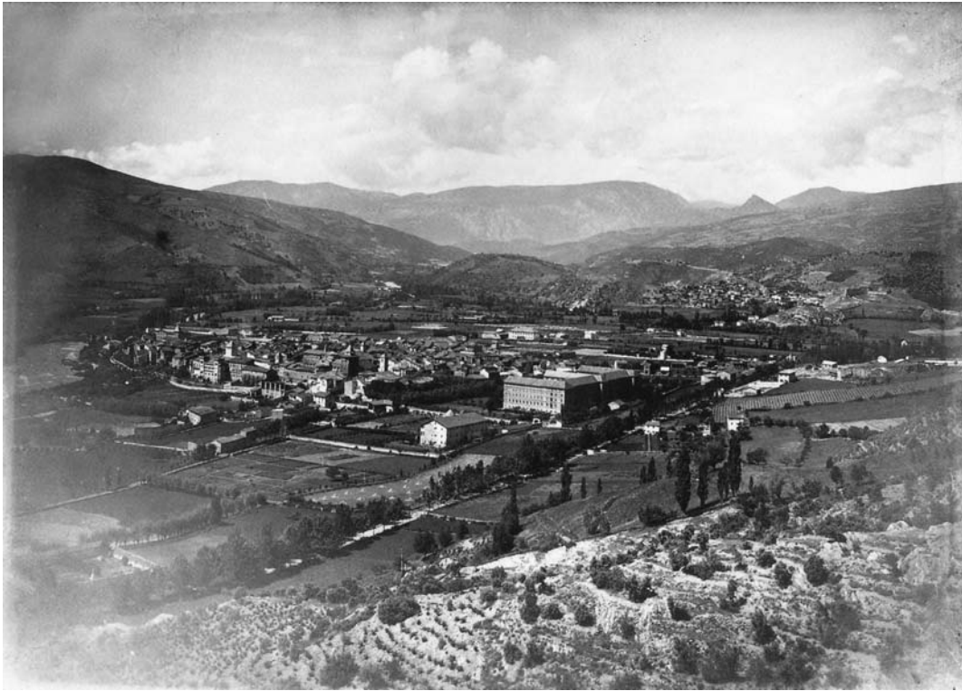
Conreus de vinya a prop de la Seu.

de cinc anys va destruir les vinyes. Si tenim en compte que la vinya era el principal conreu que es comercialitzava, la seva desaparició va suposar la ruïna per a moltes famílies. Això és el que posava de manifest el corresponçal de la revista "La Renaixença" a la Seu en anunciar el 1891 les perniciosos conseqüències que tindria l'expansió de l'insecte: