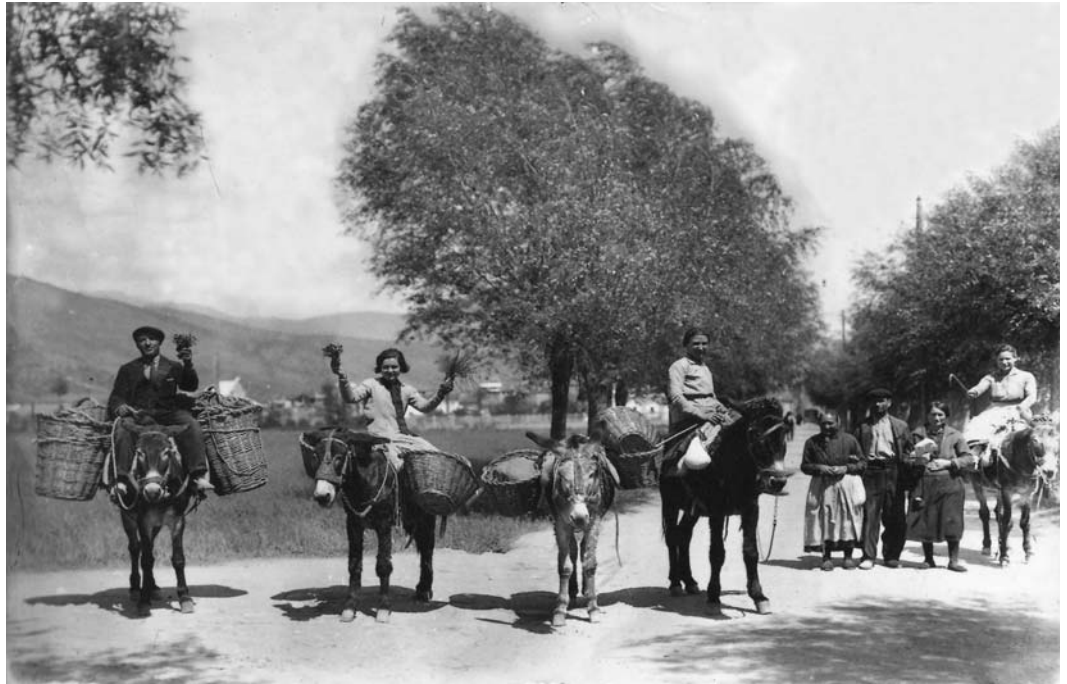
Grup de pagesos tornant del mercat de la Seu. La gran majoria eren petits propietaris.

tant pel que fa als propietaris com a la terra que controlava, cosa que accentuava, encara més, el caràcter polaritzat de la distribució de la propietat de la terra. 26