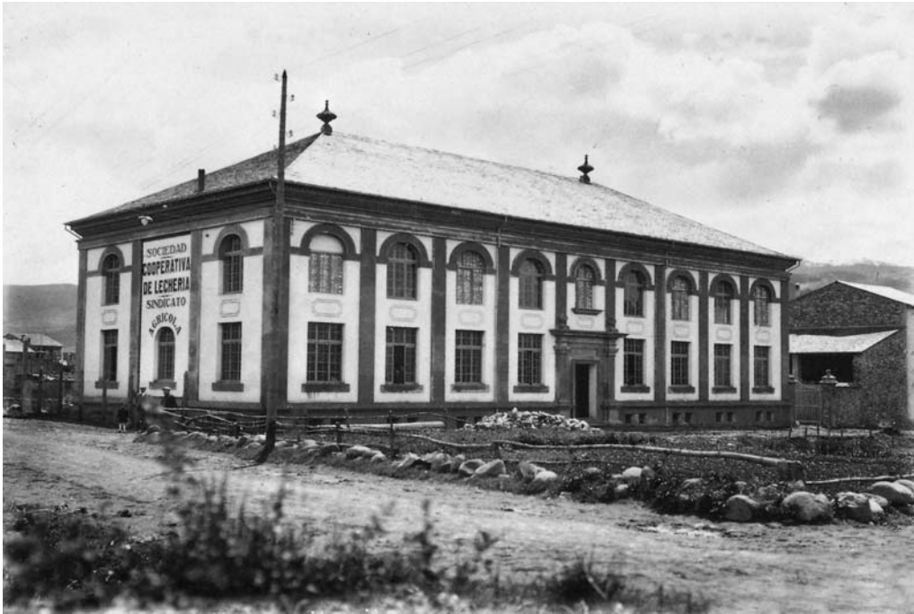
El sindicat agrícola de la Seu. Inicialment s'ubicà en un local del carrer Capdevila. L'edifici de la imatge és situat al carrer Sant Ermengol, on encara es troba actualment. Fou edificat el 1925.

l'anterior, sovint especialitzat en una branca de la producció (cellers cooperatius, sindicats de vaquers, exportadors de patates, cultivadors d'avellana). En aquestes noves associacions el discurs pairalista deixa de ser predominant i el component ideològic s'estructura sota la influència del catolicisme social, tot i que no serà de dependència confessional. Mantindran el caràcter interclassista del seu antecessor, però ara la militància serà molt més heterogènia. Així, encara que hi havia grans propietaris la majoria dels socis eren petits propietaris, arrendataris i parcers. Els nous sindicats agraris –aquest és el seu nom original– sorgiren a l'empara de la llei de la llei de sindicats agrícoles de 1906, que ofería a aquestes entitats algunes excepcions fiscals, i tingueren el suport institucional de la Mancomunitat de Catalunya a partir de 1914. 17 Crec poder afirmar, que és en aquest context històric i en el marc del segon model cooperativista on cal situar el sindicat agrícola de la Seu d'Urgell, fundat el 1915.