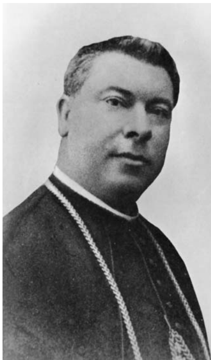
El bisbe Joan Benlloc i Vivó, impulsor dels sindicats catòlico-agraris a la diòcesi d’Urgell.

La visita dels propagandistes a la capital de la diòcesi va tenir lloc el dia 4 de setembre de 1918. Els actes, presidits pel bisbe, van tenir lloc a la seu de “l’Instituto Obrero” i va fer