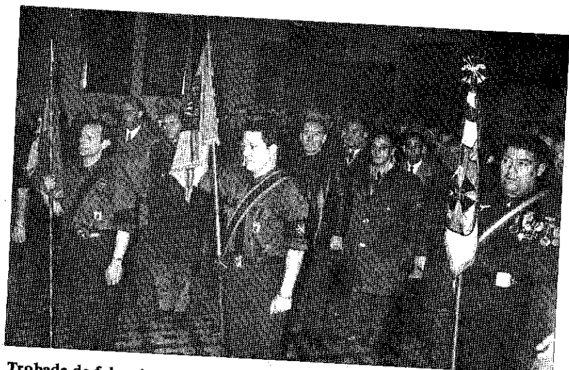
Trobada de falangistes a l'Ajuntament.

(sobre el nivell demogràfic de l'any 1936), resultat d'uns enfrontaments directes més clars que palesen una repressió més concreta davant d'actituds econòmiques i actuacions personals molt confrontades durant la guerra civil.