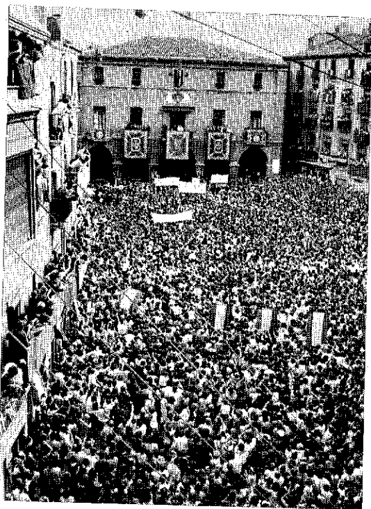
Feixisme. Congregació en un acte en l'època franquista.

Les acusacions de postguerra civil seguirien aquest camí, denúncies sobre actuacions personals o actituds polítiques lligades a la vida local des de l'època republicana i autònoma catalana i on tant la participació com la responsabilitat pretesa que es deia hom tenia sobre els mateixos -sovint impossible-, duria aquestes persones a un Consell de Guerra militar que els condemnaria i faria executar en el Camp de la Bota de Barcelona, seu de l'Auditoria de Guerra, amb una indefensió absoluta i sense cap mena de garantia jurídica en la Justícia,