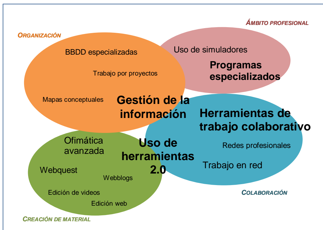
Ilustración. Propuesta de mapa de necesidades formativas para el profesorado del Grado en turismo de la EUHT CETT