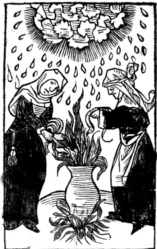
Les bruixes barrejaven els ingredients necessaris per provocar morts i calamitats. Gravat de l'obra d'Ulrich Molitor De Ianiis et phitoniciis mulieribus. c. 1489. Biblioteca de la Universitat de Glasgow.

y bruxarias ha fetas ab lo art del dimoni y en companyia de qui, y com de tot diga la veritat.