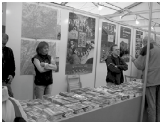
3a Fira del Libre de Muntanya.