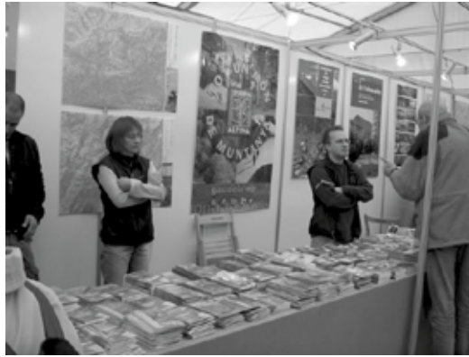
3a Fira del Libre de Muntanya.