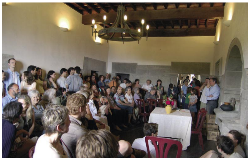
Presentació del llibre "A castle in Spain"