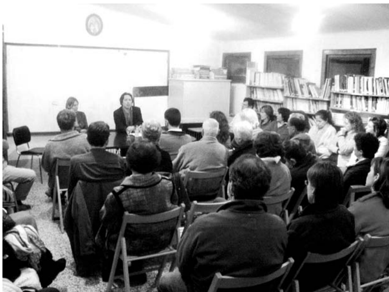
l'OEMUC (Orquestra de les Escoles de Música de Catalunya).

Organitzat per la comissió de festes del poble, el dia 27 de maig va tenir lloc a l'església de Tavertet un concert fet per l'orquestra formada per alumnes de 2on cicle de Grau Mitjà de les escoles de Vic i Manlleu. Van interpretar obres de J. C. Bach, Gustavson, G. Holst, J. Sibelius i P. Strep, que van ser molt aplaudides pel nombrós públic assistent. Aquesta orquestra inclou joves d'edats entre els 14 i els 17 anys, alguns dels quals ja formen part d'orquestrats importants com la JONC (Jove Orquestra Nacional de Catalunya) o