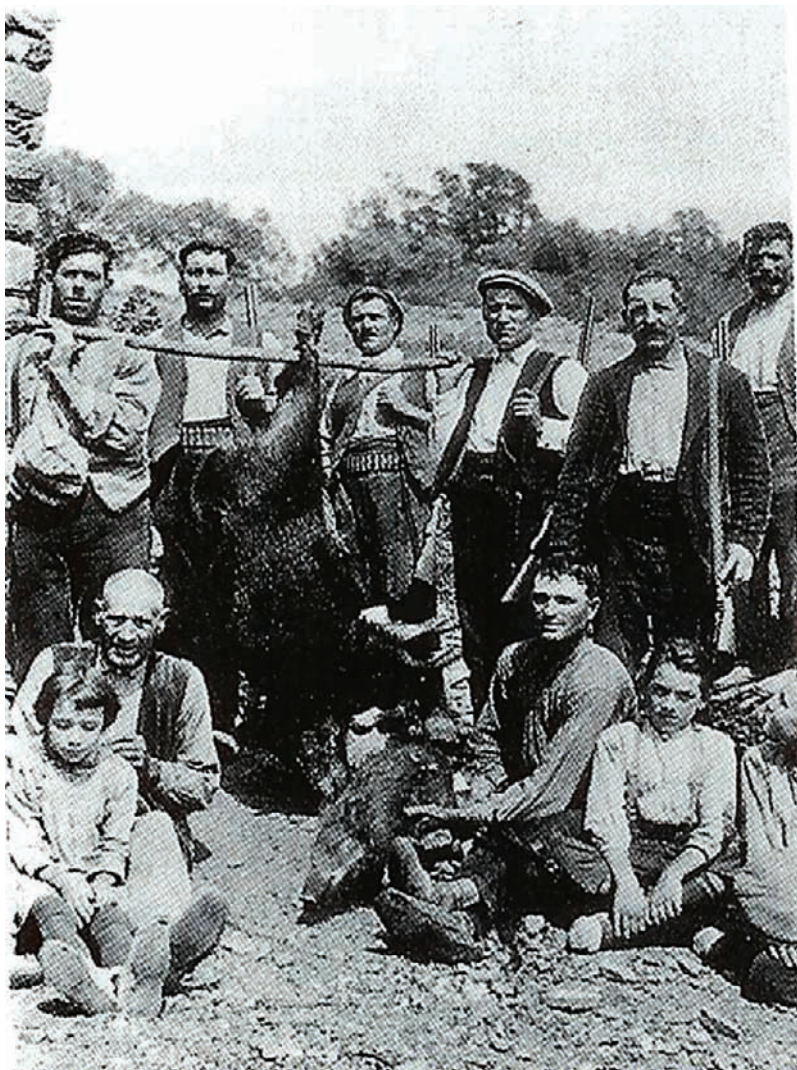
Caçadors del senglar a l'Alt Empordà a primers del segle xx.

en terres del mas Tresserra, i el setembre del mateix any un veí de Roda és denunciat per caçar amb escopeta i dos gossos conillers (se li requisa l'arma i un conill mort). Encara el mateix setembre són denunciats tres manlleuencs per caçar a Sobrepuig a les sis del matí provistos de escopetas y llevando cinco perros ; El 1907, al juny, el masover de Puigdauret és processat perquè el van trobar prop del mas Garolera que regresaba de cazar con una escopeta de dos cañones y cuatro perros, tres de estos pertenecientes al manso Garolera y uno de suyo . A principis de setembre, encara 1907, cinc individus són sorpresos pels mossos de Corcó a Santa Margarida quan es dedicaven a cazar con escopeta y perros en dicha propiedad, los [...] escaparon a todo correr . Un dels homes és un home de Manlleu anomenat Capdeferro, contra el qual dos dies més tard, el dia 4 de setembre s'obre un altre procés per uns fets del 15 d'agost, quan el guarda jurat el va trobar con una escopeta de un cañon sistema Lefauxe y cuatro perros