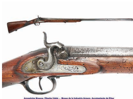
Armagntza Museo. Eibarho Udala - Museo de la Industria Armera. Ayuntamiento de Eibar

Escopeta de pistó. Museu de la indústria armera. Eibar