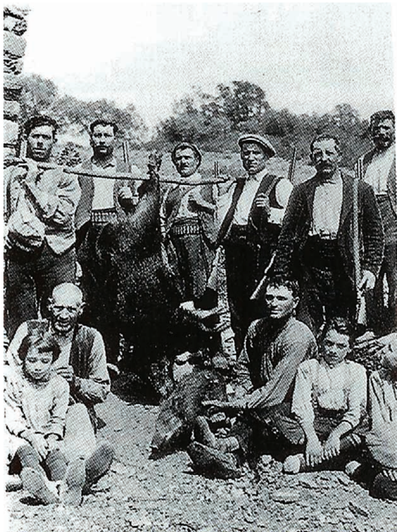
Caçadors del senglar a l'Alt Empordà a primers del segle xx.

en terres del mas Tresserra, i el setembre del mateix any un veí de Roda és denunciat per caçar amb escopeta i dos gossos conillers (se li requisa l'arma i un conill mort). Encara el mateix setembre són denunciats tres manlleuencs per caçar a Sobrepuig a les sis del matí provistos de escopetas y llevando cinco perros ; El 1907, al juny, el masover de Puigdauret és processat perquè el van trobar prop del mas Garolera que regresaba de cazar con una escopeta de dos cañones y cuatro perros, tres de estos pertenecientes al manso Garolera y uno de suyo . A principis de setembre, encara 1907, cinc individus són sorpresos pels mossos de Corcó a Santa Margarida quan es dedicaven a cazar con escopeta y perros en dicha propiedad, los [...] escaparon a todo correr . Un dels homes és un home de Manlleu anomenat Capdeferro, contra el qual dos dies més tard, el dia 4 de setembre s'obre un altre procés per uns fets del 15 d'agost, quan el guarda jurat el va trobar con una escopeta de un cañon sistema Lefauxe y cuatro perros