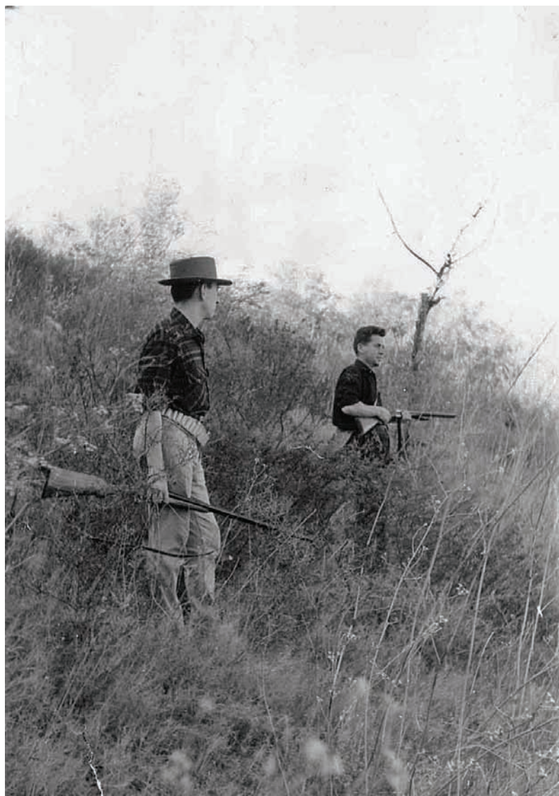
Caçadors de perdiu a l'aguait en un marge d'unes vinyes a l'Alt Empordà.

vist de Rupit, un dels inconvenients era que el procés de càrrega era laboriós perquè es portaven per separat els perdigons, la pólvora i els pistons.