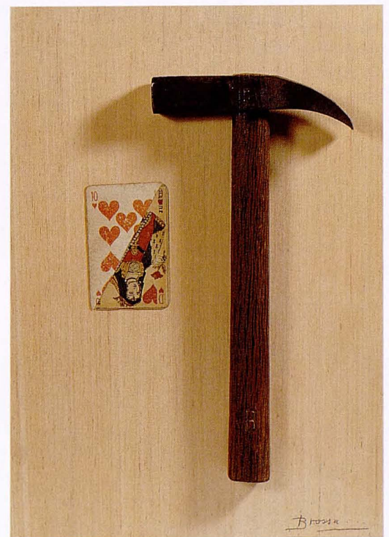
MARTELL I CARTA. POÈME OBJET (1951)