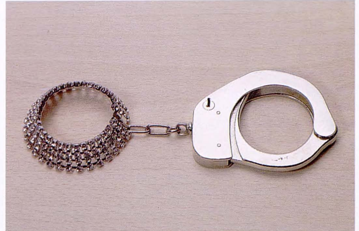
POÈME OBJET (1988)