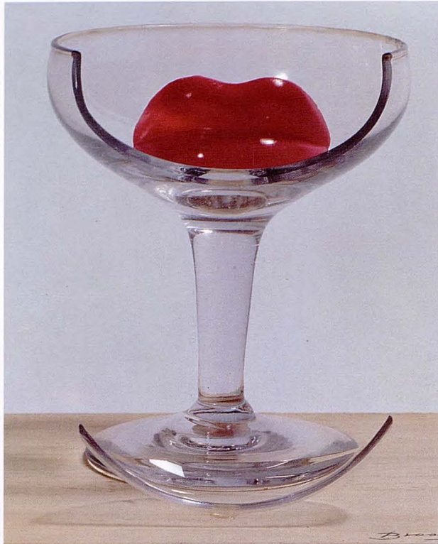
POÈME OBJET (1975)