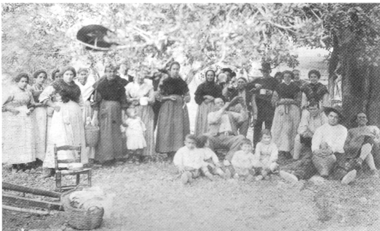
Des de temps immemorials hi havia el costum d'anar a celebrar la Pasqua –i menjar-se la mona– a les ermites properes al poble. Grup familiar de Santa Bàrbara celebrant el dia de Pasqua a l'ermita del Carme, al terme de Tortosa.