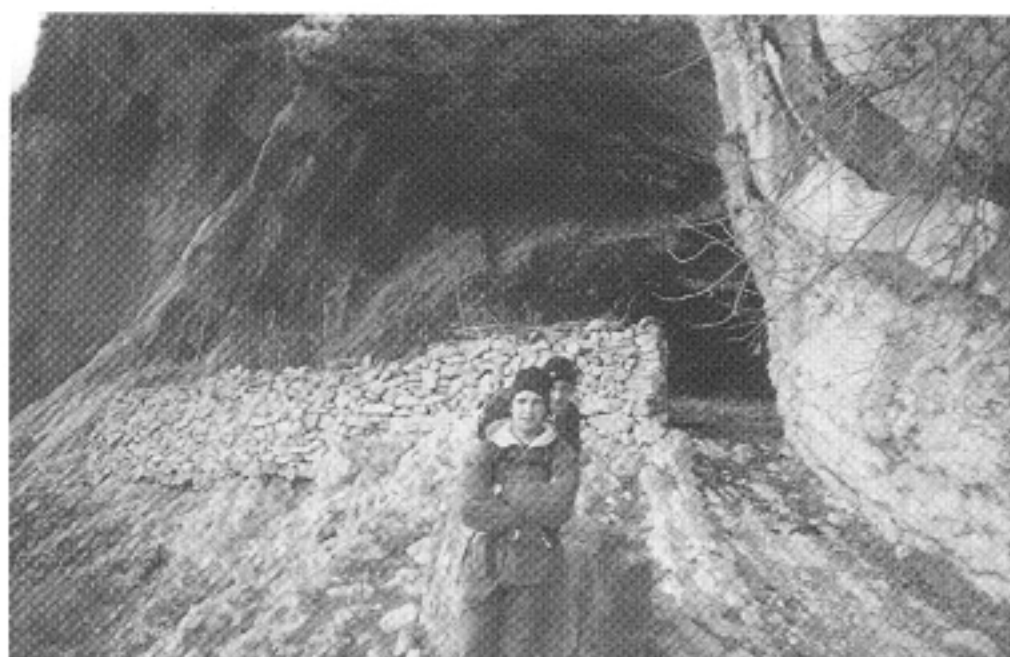
▲ Cova del Adells. Cova utilitzada pels maquis per a viure i protegir-se de les inclemències del temps. Esta cova també va ser utilitzada pels pastors per a guardar els ramats.

La vida d'estes persones era molt dura; no vivien sinó que sobreviuen. Segons les fonts a què hem tingut