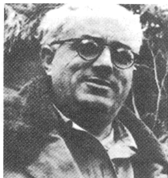
▲ El general Yagüe.

El moment de l'inici de la batalla, és casualitat o no és casualitat? Perquè no està clar si la batalla havia de començar abans. En qualsevol cas, fan coincidir el començament amb el dia de sant Jaume, patró dels exèrcits, cosa que explotarà la propaganda republicana: "Aquí només hi ha un exèrcit, que és l'exèrcit popular de la República; l'altre és l'exèrcit dels alemanys, dels moros, dels no sé què."