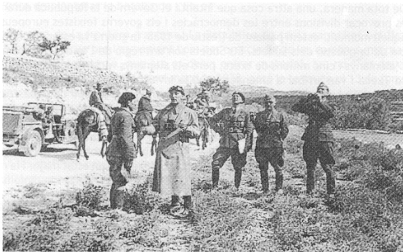
▲ Comandaments de la Legió Còndor, a la carretera de Morella a Vinaròs el 1938.

a la conclusió que els qui més es van saltar la no-intervenció van ser els alemanys i els italians: la Legió Còndor va arribar a tindre 4.000 homes i 150 avions operatius, i el Corpo de Tropi de voluntaris italians va tindre 70.000 soldats en divisions d'infanteria i de carros blindats. Els russos mai van tindre soldats aquí; el que van tindre van ser assessors militars, i alguns d'ells, dolentíssims. Stalin, en el moment en què es produïx la guerra espanyola, està enmig dels processos de Moscú, perseguint dissidents, matant generals, purgant l'exèrcit, perquè té por que l'expulsen del poder, i, en aquella situació, alguns dels militars que envia a la República són molt talossos, molt dolents, encara que també n'hi ha de