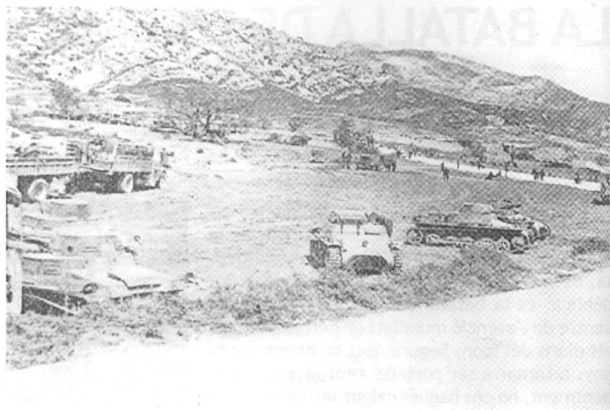
▲ Companyia de carros de combat de la Legió, que lluitava amb la 4a Divisió de Navarra de l'exèrcit de Franco, prop de la carretera de Vinaròs.

Però això no va ser així, perquè, com vosaltres sabeu, a la Sénia estaven els alemanys, en altres llocs hi havia assessors russos... En qualsevol cas, si miréssim la quantitat de militars no espanyols dins la guerra, arribaríem