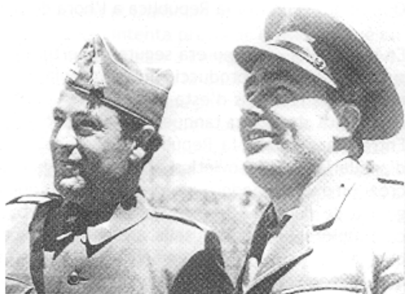
▲ Exèrcit de la República: el tinent coronel Juan Modesto, cap de l'Exèrcit de l'Ebre, amb el tinent coronel Enrique Líster, cap del V Cos de l'Exèrcit.