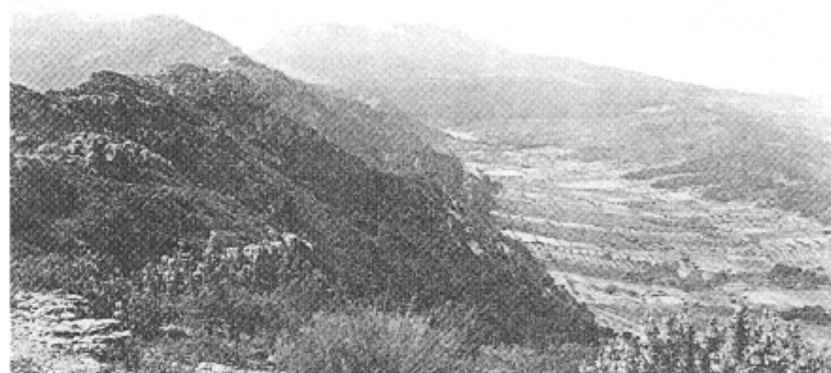
▲ Les serres de Cavalls i Pàndols, escenari de duríssims enfrontaments durant la batalla de l'Ebre.

En primer lloc, que era un atac sorpresa. En la guerra, tal com s'ensenya en els manuals d'estratègia militar, un factor molt important és la sorpresa; si s'aconsegueix fer un atac per sorpresa, és una victòria. Ara sabem que els franquistes coneixien que a l'altre costat del riu se concentraven tropes i barques i es preparaven per a passar el riu. I també sabem que Rojo, efectivament, coneixia que les tropes franquistes estaven avisades de la mobilització de les tropes republicanes. Per què Franco i els seus van ser tan passius? Entre altres coses, perquè mai van pensar que la República tingués tanta capacitat ni que hi hagués una quantitat tan gran de soldats (van arribar a passar 100.000 homes i tot l'armament). Ells mateixos es van creure la pròpia propaganda que generaven, en el sentit que la República només era bona per a recular, però no per a avançar.