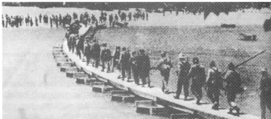
▲ Tropes republicanes passant el riu.

Quins aspectes favorables tenia la batalla de l'Ebre per a la República?