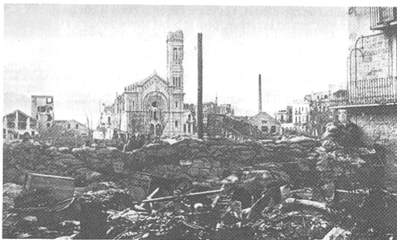
Tortosa front de guerra, 1938.