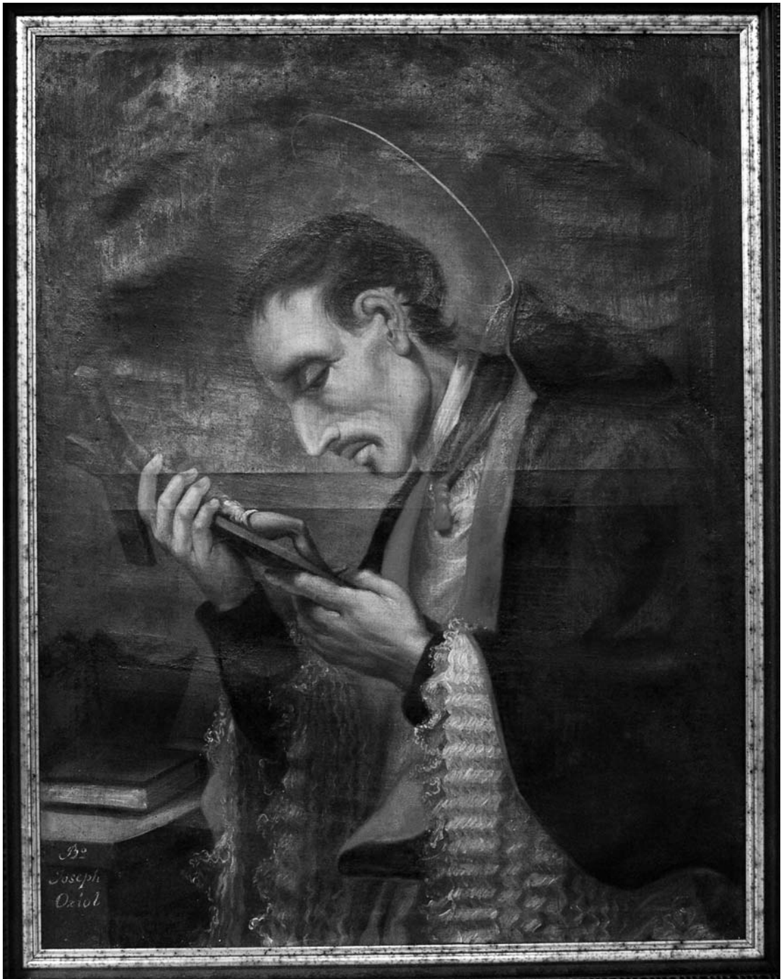
Fig. 1. Bonaventura Planella (atribuït), Sant Josep Oriol . Rectoria de l'església de la Pobla de Segur (Lleida). Procedeix de l'església parroquial de Serradell (Lleida).