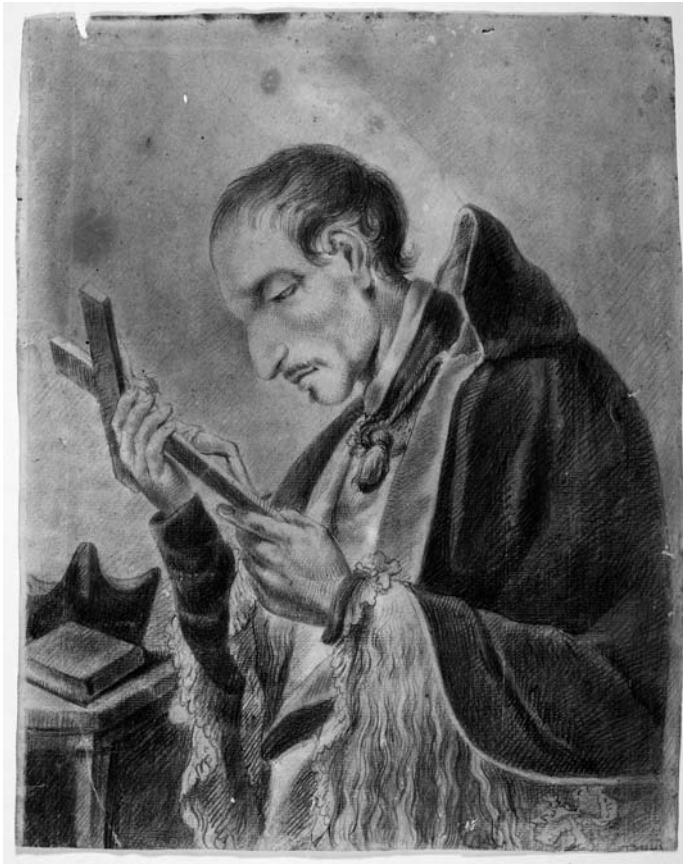
Fig. 3. Bonaventura Planella (atribuït), Sant Josep Oriol . Gabinet de Dibuixos i Gravats del Museu Nacional d'Art de Catalunya (MNAC/GDG 108723 D).

ubicada al retaule que l'església tenia pensat erigir en honor del beat Oriol, desig que finalment no va poder acomplir-se. 5