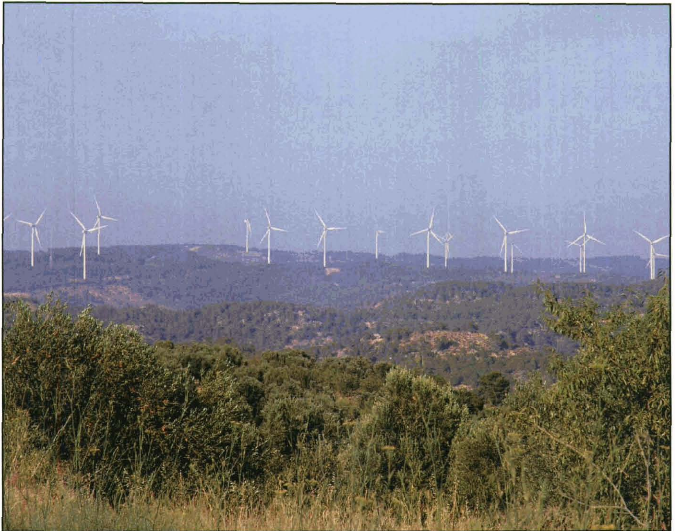
Vista dels molins des de la carretera de Calaceit