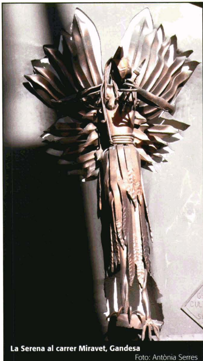
La Serena al carrer Miravet, Gandesa

La Serena . Revista. Núm.11, octubre de 1999