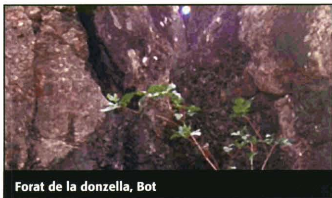
Forat de la donzella, Bot