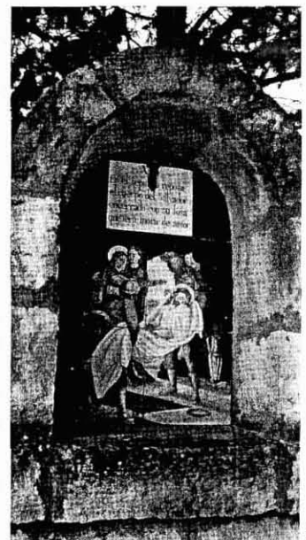
Pilaret del Viacrucis