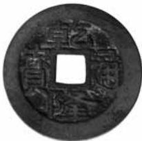
Fig.16. Qian Long Tong Bao Dinastia Qing, 1736-95. Anvers BMVB, núm. d'inventari 2581