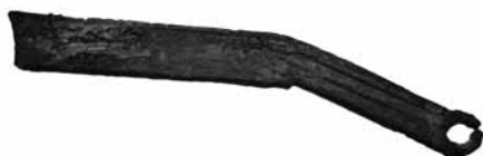
Fig.3. Moneda-ganivet Ming 400 a. C. - 220 a. C. (109mm x 22mm x 12mm) BMVB, núm. d'inventari 2575