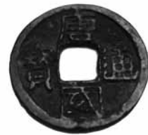
Fig.12. Tang Guo Tong Bao. Regne Tang del Sud, 943-961 (20mm) BMVB, núm. d'inventari 2576