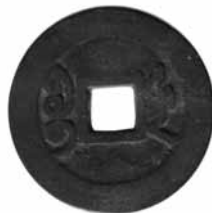
Fig.17. Qian Long Tong Bao Dinastia Qing, 1736-95. Revers BMVB, núm. d'inventari 2581