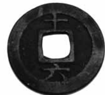
Fig.15. Chun Xi Yuan Bao Dinastia Song, 1189. Revers (24mm) BMVB, núm. d'inventari 2577