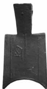
Fig.2. Moneda-aixada de mànec buit 650 a. C. - 400 a. C. (93mm x 49mm) BMVB, núm. d'inventari 2575