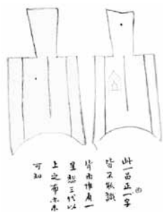
Fig. 1. 錢譜 Qián P ( Guia de monedes ) Vol 1. BMVB, núm. d'inventari 384. Pàg.2

funerarias chinas, de cartón, con grabados y plateados, y una hermosísima placa japonesa, de cobre, con figuras de gran relieve, muy bien dibujadas.” 60 Cal remarcar, però, que de moment desconeixem l'ús particular de les monedes funeràries donades per Toda al Museu.