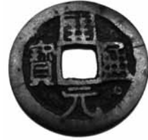
Fig.9. Kai Yuan Tong Bao Dinastia Tang, 845-846. Anvers (24mm) BMVB, núm. d'inventari 2576