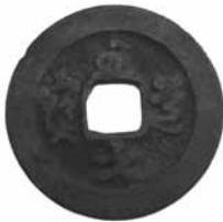
Fig.13. Zhi Dao Yuan Bao Dinastia Song, 995-997 (25mm) BMVB, núm. d'inventari 2579