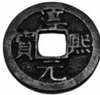
Fig.14. Chun Xi Yuan Bao Dinastia Song, 1189. Anvers (24mm) BMVB, núm. d'inventari 2577