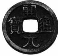
Fig.8. Kai Yuan Tong Bao Dinastia Tang, 621-718. (24mm) BMVB, núm. d'inventari 2576