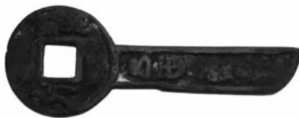
Fig.6. Moneda-ganivet, Wang Mang Dinastia Xin. 7-23 (71mm x 26mm) BMVB, núm. d'inventari 2575