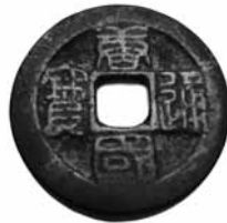
Fig.11. Tang Guo Tong Bao. Regne Tang del Sud, 959-961 (24,5mm) BMVB, núm. d'inventari 2576