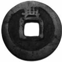
Fig.10. Kai Yuan Tong Bao Dinastia Tang, 845-846. Revers (24mm) BMVB, núm. d'inventari 2576