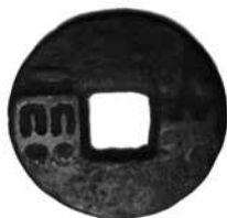
Fig.5. Moneda Ban Liang s.IV a. C. - II a. C. (27mm) BMVB, núm. d'inventari 2575