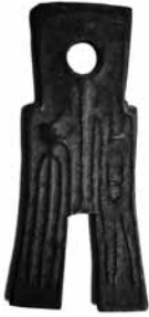
Fig.7. Moneda-aixada, Wang Mang Dinastia Xin, 7-23 (50mm x 22mm) BMVB, núm. d'inventari 2575