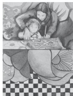
VOLUNTAD DE-FORMA IV. 15,5x21 cm. Grafito sobre papel. 2010..... 151