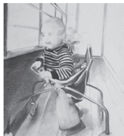
VOLUNTAD DE-FORMA III. 17,8x19,5 cm. Grafito sobre papel. 2010..... 145