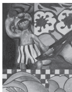
VOLUNTAD DE-FORMA V. 15x19,5 cm. Grafito sobre papel. 2010..... 157