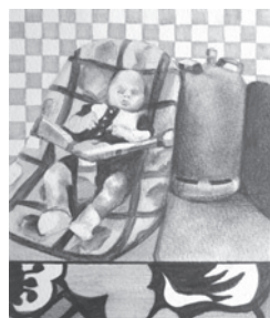
VOLUNTAD DE-FORMA VII. 16x19 cm. Grafito sobre papel. 2010..... 167