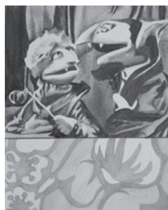
VOLUNTAD DE-FORMA II. 15,6x20 cm. Grafito sobre papel. 2010..... 15