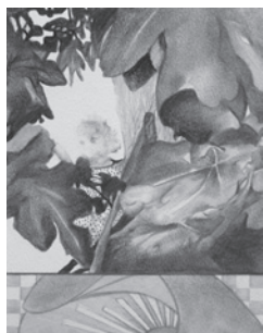
VOLUNTAD DE-FORMA VI. 20x25 cm. Grafito sobre papel. 2010..... portada