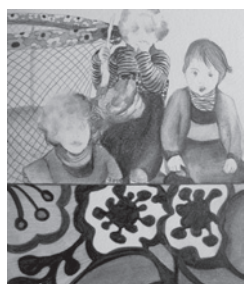
VOLUNTAD DE-FORMA I. 17x20 cm. Grafito sobre papel. 2010..... 5