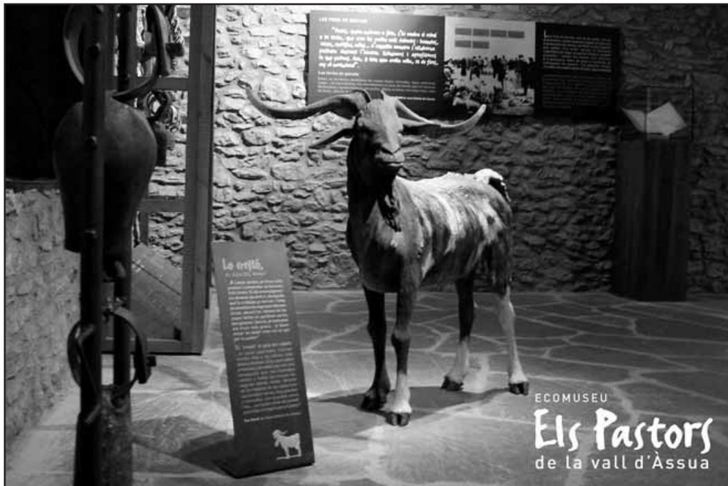
El cretò, l'autèntic guia del ramat. Figura hiperrealista de resina.

El segon àmbit introdueix el visitant dins el món dels pastors, i presenta cadascun dels protagonistes d'aquest museu. A través d'un audiovisual, seran els mateixos pastors de la