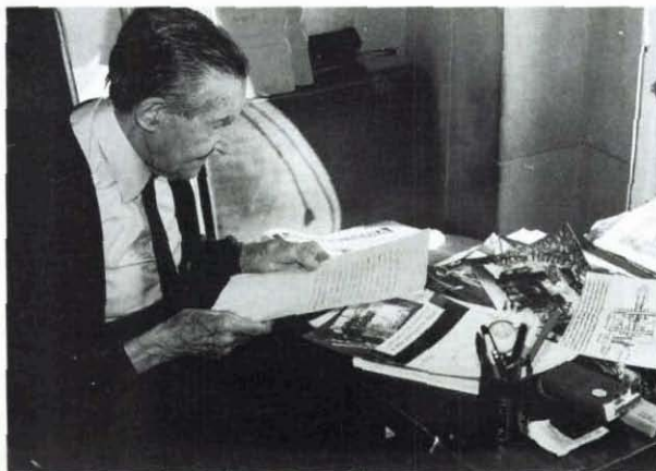
Investigador tenaç, redescobriria el passat industrial ripollès

L'Associació de Col·leccionistes d'Armes Antiques, de Barcelona li va dedicar un homenatge el 1981, en el decurs del qual se li entregà un pergamí i va ser nomenat soci d'honor de l'entitat.