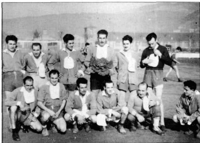
Un partit "de costellada" amb els companys.