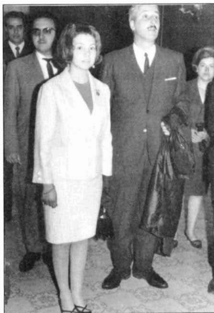
1967. Des del CIT s'impulsà l'elecció de la pubilla de Ripoll.

Pel que fa a la projecció pública, l'exquisit tacte personal i un sòlid criteri que exercia amb subtil prudència eren les seves principals virtuts. De fet, havia estat lligat