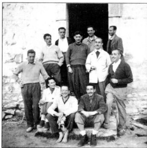
Agost del 1954. Al refugi de la Renclusa, al massís de la Maladeta.

La inquietud que el movia i un innat do de gentes el menaren, de ben jove, a combinar el treball amb la dedicació a certes manifestacions culturals i cíviques. Així, a part d'haver estat a la junta del Club Excursionista Pirenaic —que més tard esdevindria Club Excursionista Ripoll—, del qual arribà a ser president, fou vice-president de l'Agrupació Ripollesa d'Iniciatives Culturals (ARIC) i del Centre d'Iniciatives i Turisme (CIT) des d'on, amb d'altres entusiastes, promogué l'elecció