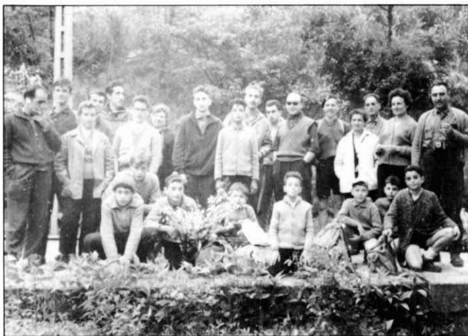
Una sortida, als primers anys seixanta, amb membres de la secció infantil del CEP.

Tot i que havia nascut a Anglès (la Selva) el 16 de gener de 1922, al cap de pocs mesos la família s'establí a Ripoll, on ell residiria ja sempre més. Abans de complir