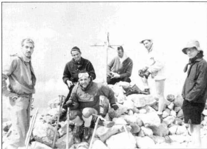
Agost del 1959. Al cim del Mont Perdut (3.352 m).