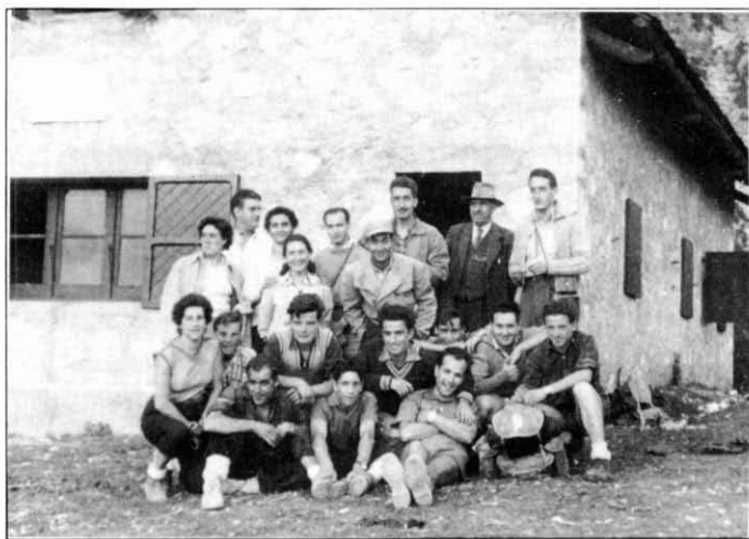
18 de juliol del 1957. Al refugi "Lluís Estasén", a la Jaça dels Prats, al Pedraforca.

Altra vegada s'immergí en l'estudi d'un tema concret, que el va dur a publicar -el 1993- El Ripollès. Molins fariners . Poble per poble, ressegueix tota la contrada per