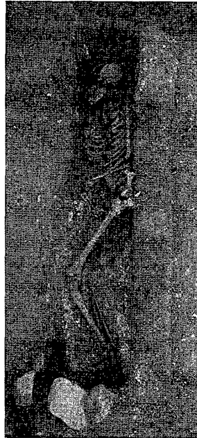
lám. 8. Esquelet en decúbit lateral dret, el qual duia mortalla i les mans juntes.

imparell de sudaris, les mans i els peus eren nugats junts (Martínez, 1988, pàg. 199). Aquesta pràctica es veu en alguns casos clarament quan els ossos dels esquelets es mostren molt junts. També es constata per l'existència d'agulles de bronze que enganxen les teles.