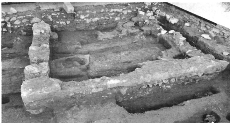
lám. 5. Vista general del Panteó.

A la zona sud-oest de l'excavació es va localitzar la construcció identificada com un recinte funerari o Panteó ( lám. 5 ). Aquest està delimitat per tres murs de paredat, de 0,50 metres d'alçada, amb una planta trapezoïdal. Els murs occidental i oriental tenen una orientació nord-sud. Els seus extrems conservats traven amb el mur septentrional que presenta una orientació est-oest. Mentre que els extrems oposats es troben afectats pel mur de frontera de la casa contemporània i el límit de l'excavació. Aquest fet no ha permès la constatació de la llargària original ni del mur meridional. Tampoc es va identificar l'accés a la construcció.