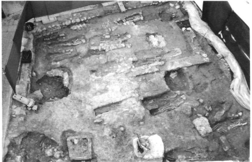
lám. 1. Vista general de l'excavació del c/ Pau, 12.

metres quadrats ( lám. 1 ). Les restes constructives modernes afectaren el nivell superficial de la necròpolis i a algunes de les tombes en profunditat. Quan es va retirar el nivell d'habitació contemporani amb una potència minsa, aparegueren de seguida els esquelets de la necròpolis.