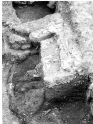
lám. 7. Coberta de rajoles i morter de la Tomba 206, a l'interior del Panteó.

Aquest tipus d'estructura funerària està documentada en cementeris de Tunis i s'anomena tourbet – tourbas en plural-. Estava reservada a una elit privilegiada i es localitzava tant als cementeris comuns com dispers per la medina. És una construcció sense coberta i reservada als membres d'una mateixa família (El Gafsi, 1989). A Granada, un testimoni de l'època observa que les persones de classe mitjana alçaven uns murs baixets i formaven com un tancat que servia de panteó a tota una família (Torres, 1983). Les referències a aquesta classe de recinte funerari confirmen el seu ús per a les classes socials benestants, així com la seva construcció, exempta i sense coberta, que permetia observar les sepultures de l'interior.