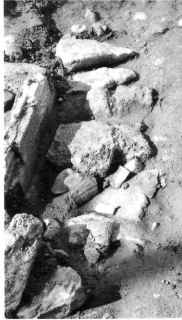
làm. 4. Coberta de lloses calcàries planes en una tomba d'adult.

fase i es documenta un cas semblant en la necròpolis islàmica de Valladolid (Balado i altres, 1992).