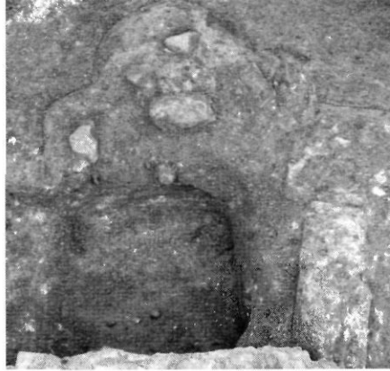
lám. 6. Preparació per a la senyalització d'una tomba del Panteó.

fileres, la primera centrada respecte els murs occidental i oriental, i la segona situada a l'oest d'aquella. Les sepultures presenten les fosses amb preparacions acurades de morter i a l'exterior es conserven dos basaments de senyalització ( lám. 6 ) i una coberta ( lám. 7 ). Al nivell superior les tombes es superposen mantenint els tractaments de les fosses, però no s'han conservat elements externs, atès l'afectació posterior del Panteó per enterraments.