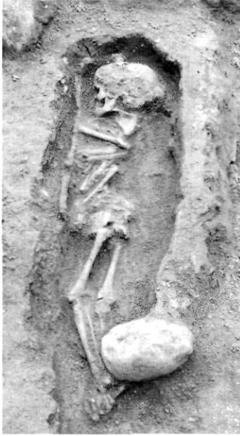
làm. 3. Tomba infantil amb preparació d'argila a la paret esquerra i pedra que subjecta l'esquelet.

L'últim tipus de preparació es redueix a la construcció de petits sòcols a les parets més llargues de la fossa. Aquestes construccions difereixen des del simple arrencament de pedres sense lligar o lligades amb argila, sense carejar, amb sols una filada fins aquelles tombes on apareixen dos murets paral·lels de dues filades amb pedres mitjanes carejades a l'interior i travades amb morter ( làm. 2 ). Als extrems més curts de la fossa sol disposar-se rajoles o pedres en vertical. Aquest element constructiu es relaciona en alguns casos amb la sustentació de la coberta. D'aquesta classe s'han documentat 30 sepultures, relacionades amb la segona i tercera fase. En la primera fase hi ha 1 exemple amb dues pedres col·locades als costats de l'esquelet, per suportar la coberta de lloses. Tanmateix en 2 sepultures s'arranjaren dues rajoles als costats dels peus del difunt, per mantenir-lo en la posició inestable en què es va disposar.