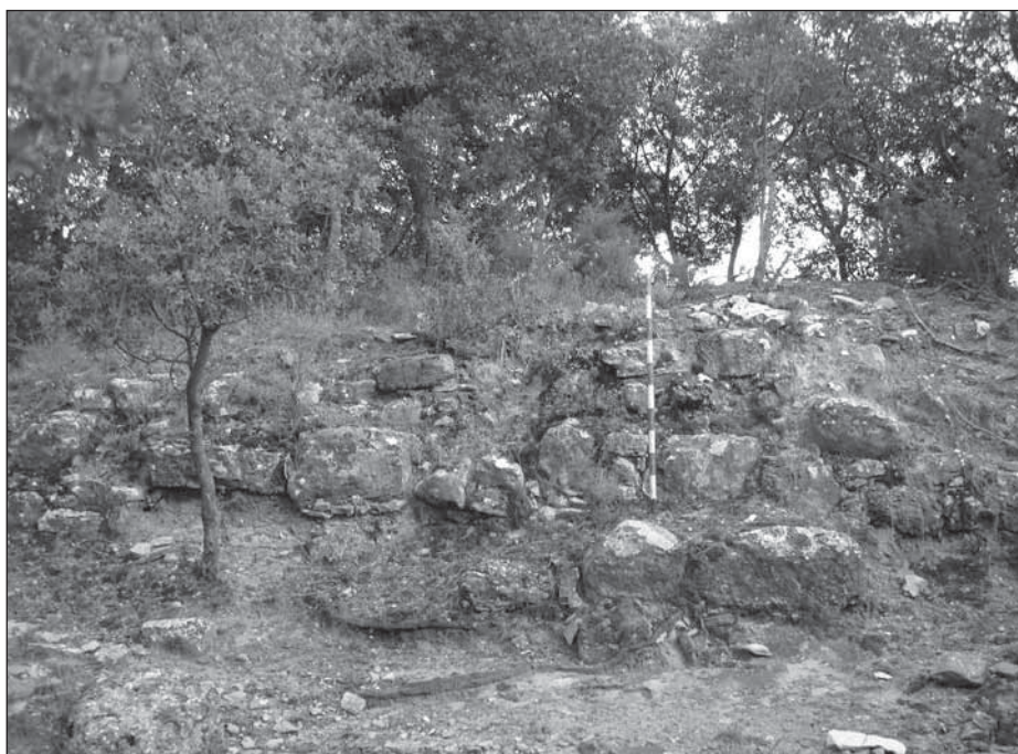
Fig. 5- Restes de murs al sector occidental del turó