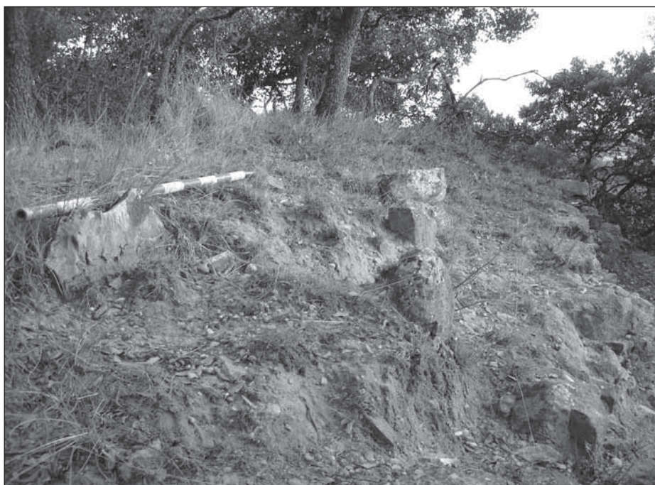
Fig. 4- Restes d'un enterrament sobre el mur perimetral de Mata