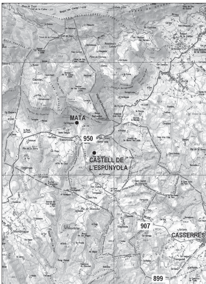
Fig. 1- Restitució hipotètica i evolució del terme parroquial de Sant Salvador